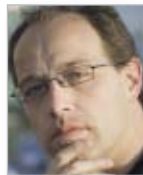
PROF. FRANCESC TORRALBA ROSELLÓ

Ordinarius des Kirchenrechts an der Universität Foggia und Advokat des Foro von Roma. Mitglied des Panel of Experts on Freedom of Religion or Belief bei der Organisation für Sicherheit und Zusammenarbeit in Europa (OSCE) und des Komitees für Rechtsfragen der Europäischen Bischofskonferenz (COMECE).